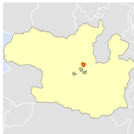
Localización del AEV dentro del término municipal