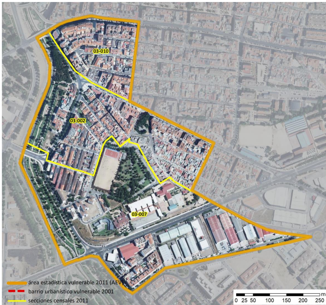
Localización en detalle del AEV