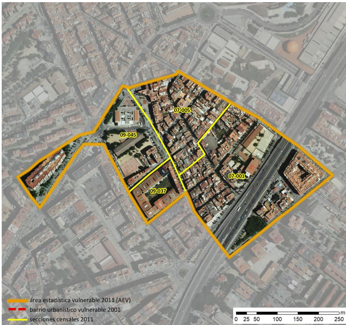
Localización en detalle del AEV