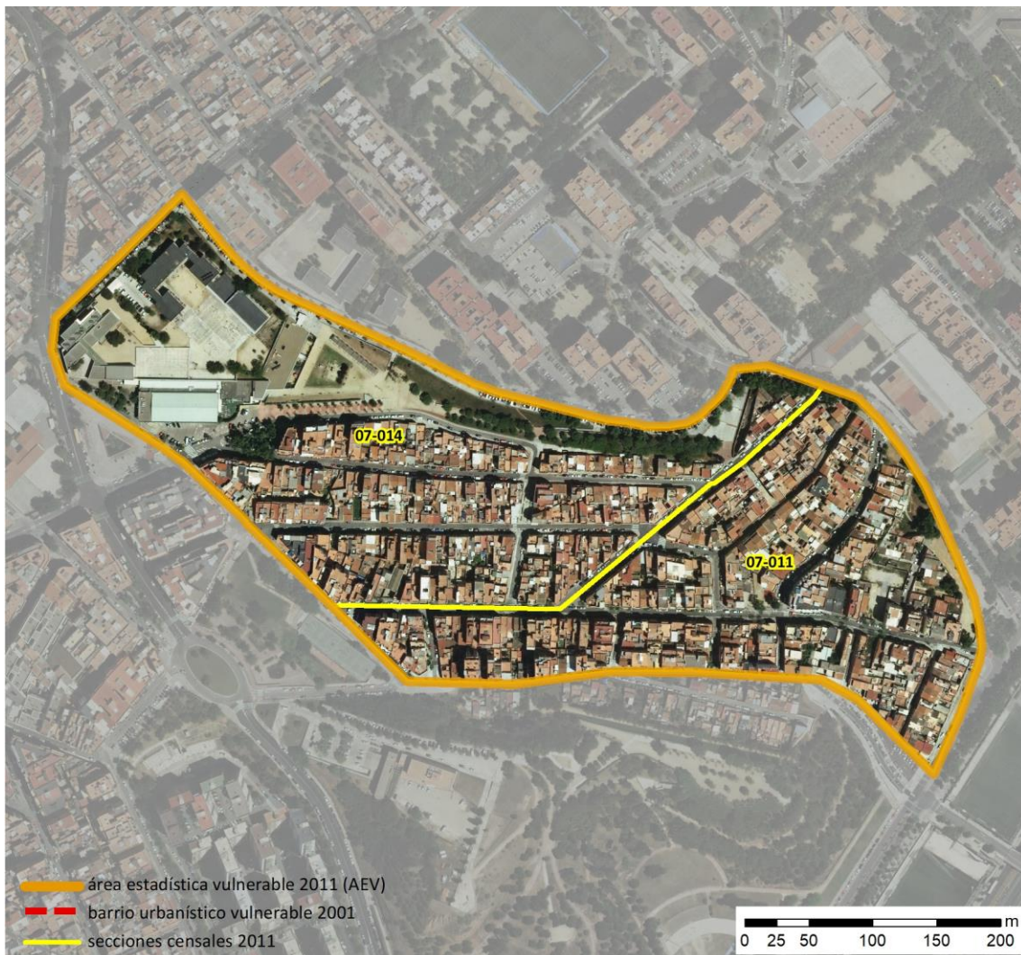
Localización en detalle del AEV