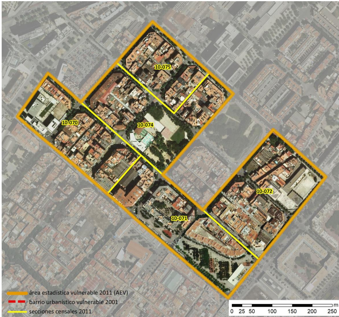
Localización en detalle del AEV