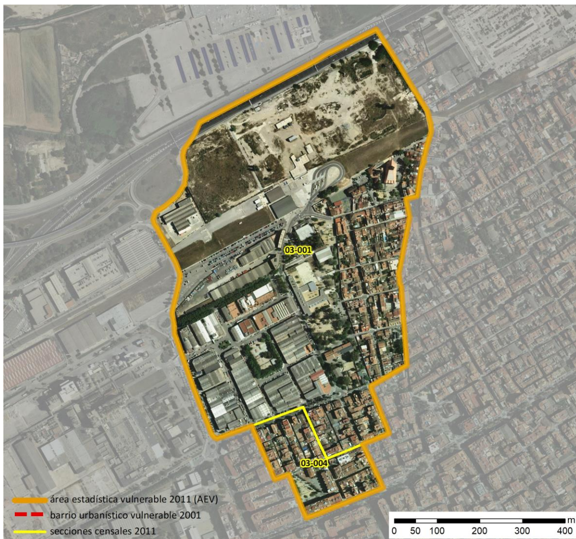
Localización en detalle del AEV