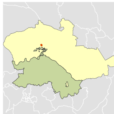
Localización del AEV dentro del término municipal