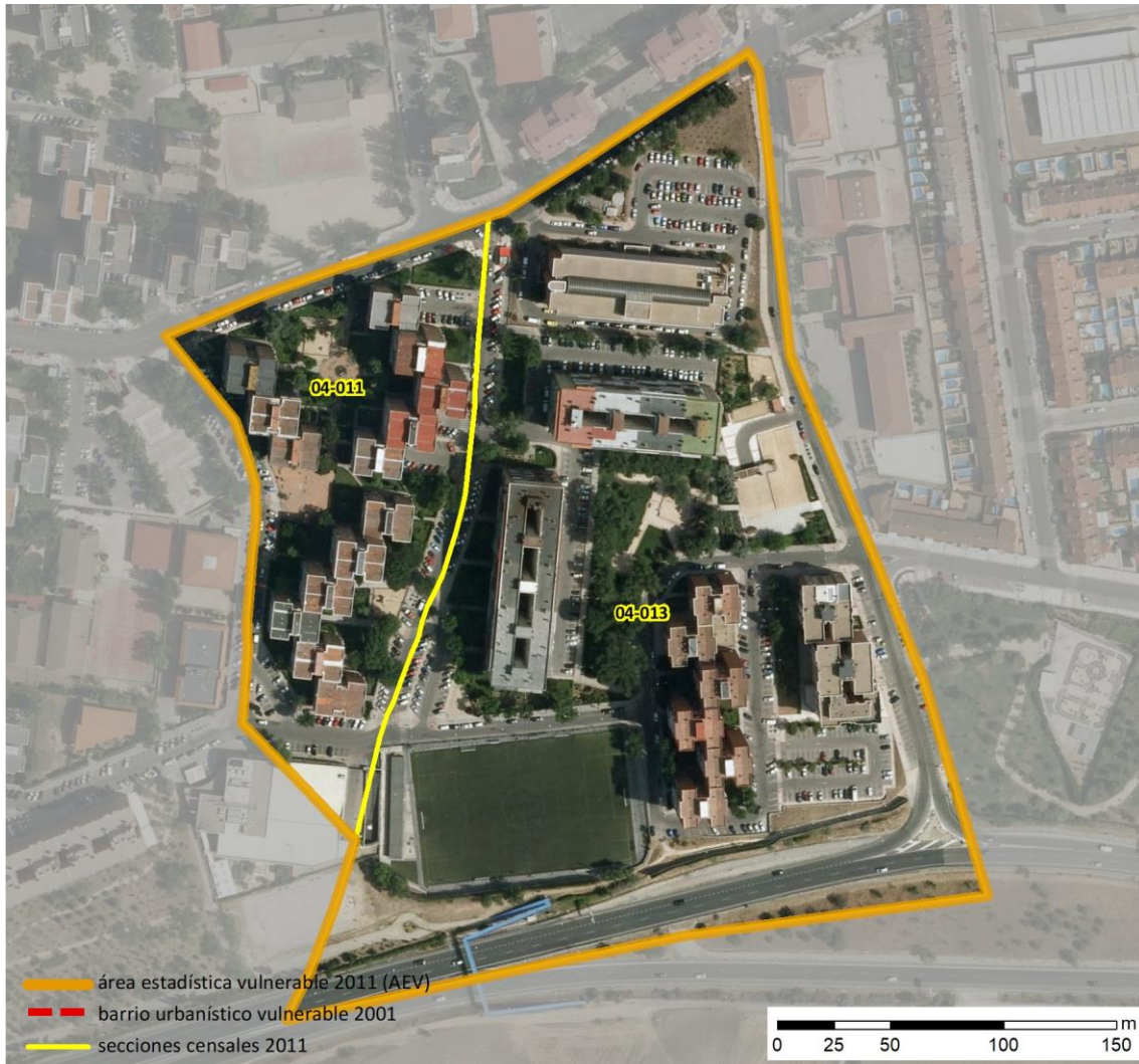
Localización en detalle del AEV