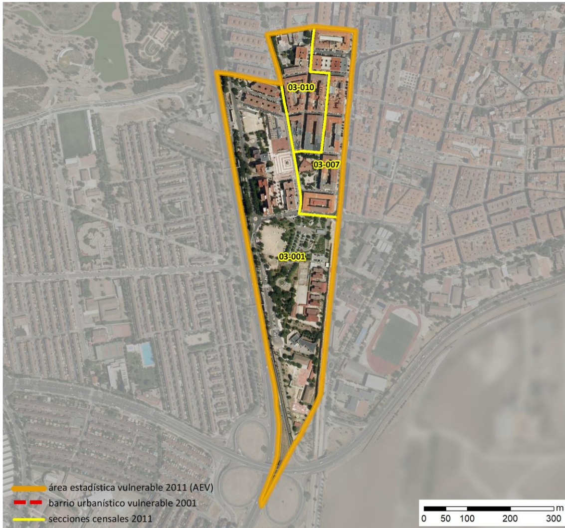
Localización en detalle del AEV