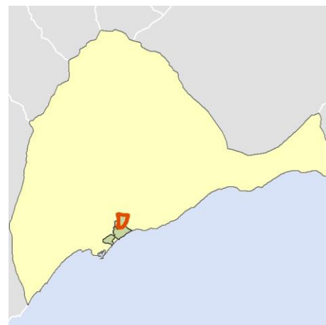
Localización del AEV dentro del término municipal