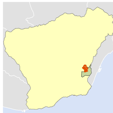
Localización del AEV dentro del término municipal