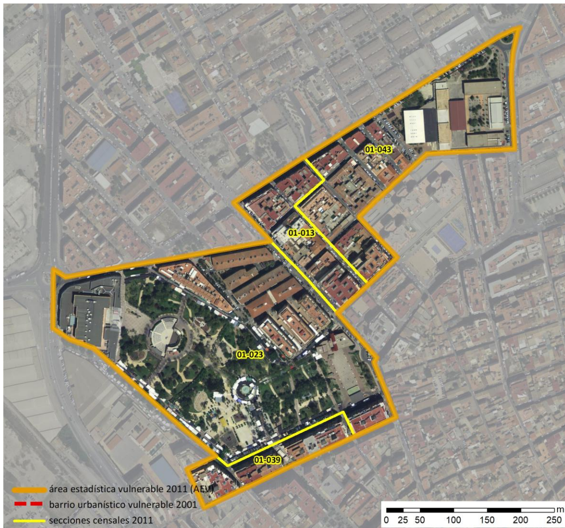
Localización en detalle del AEV