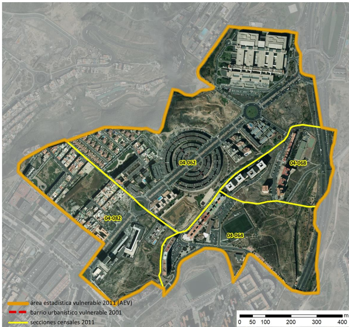
Localización en detalle del AEV