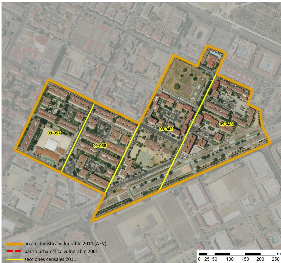
Localización en detalle del AEV