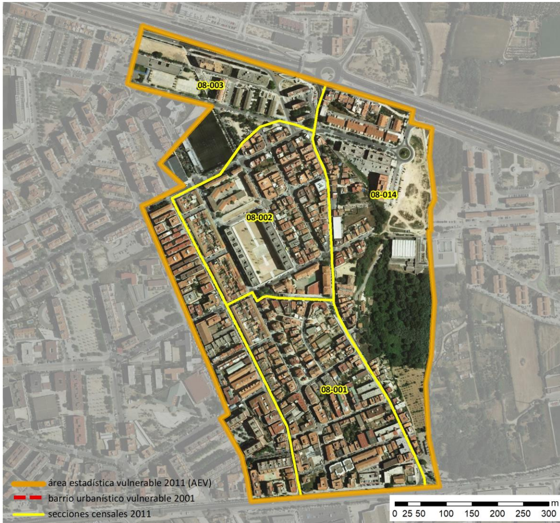
Localización en detalle del AEV