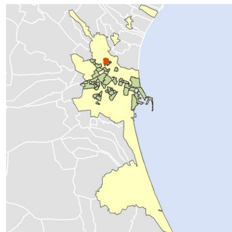
Localización del AEV dentro del término municipal