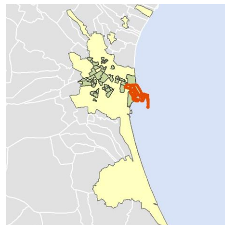
Localización del AEV dentro del término municipal