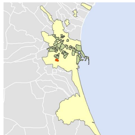
Localización del AEV dentro del término municipal