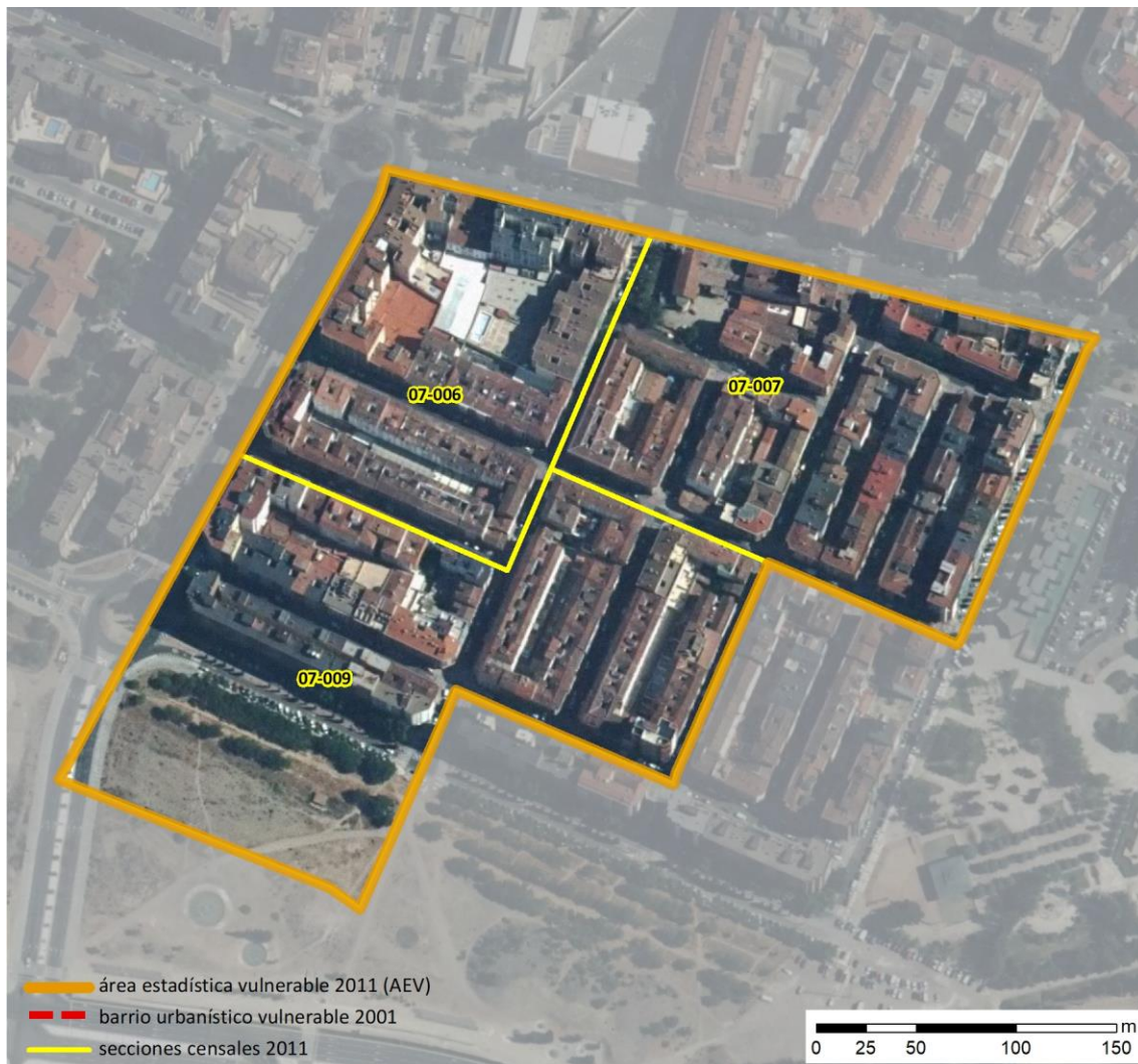
Localización en detalle del AEV