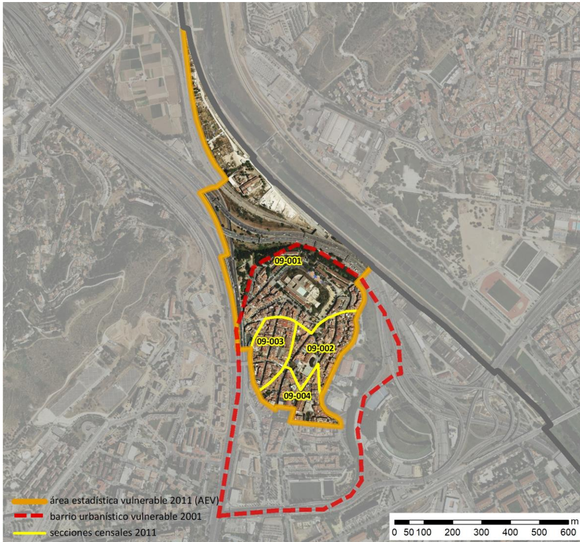
Localización en detalle del AEV