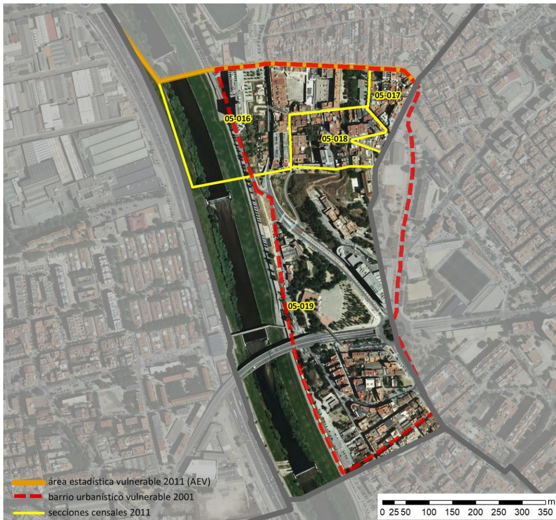
Localización en detalle del AEV