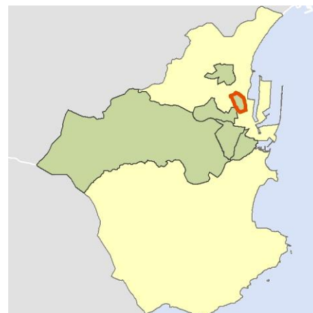
Localización del AEV dentro del término municipal