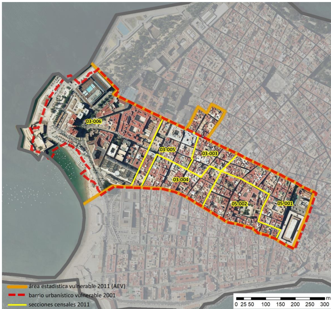
Localización en detalle del AEV