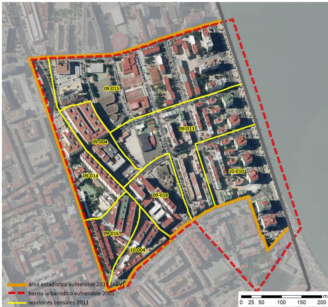
Localización en detalle del AEV