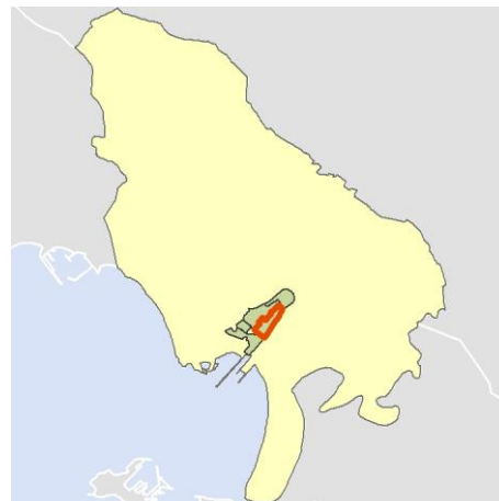
Localización del AEV dentro del término municipal