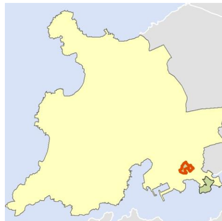
Localización del AEV dentro del término municipal