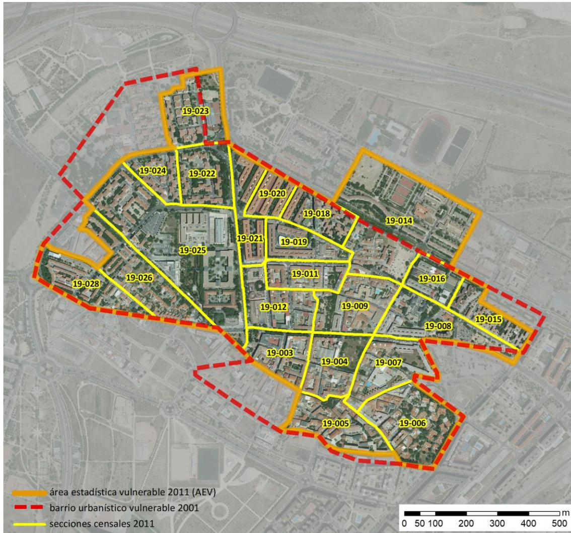
Localización en detalle del AEV