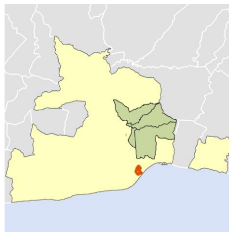
Localización del AEV dentro del término municipal