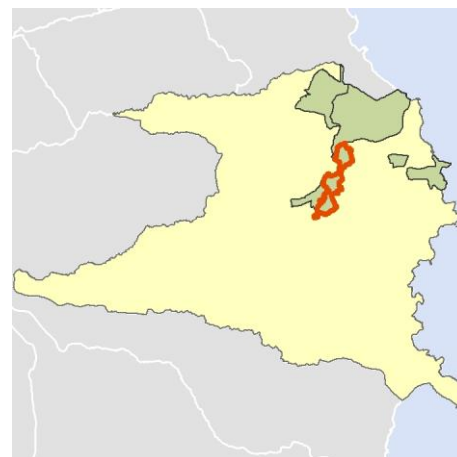
Localización del AEV dentro del término municipal