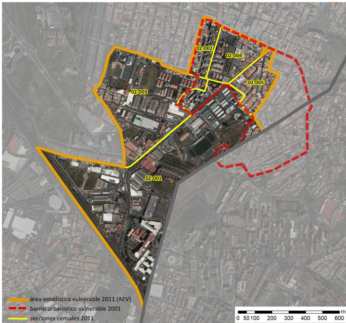
Localización en detalle del AEV