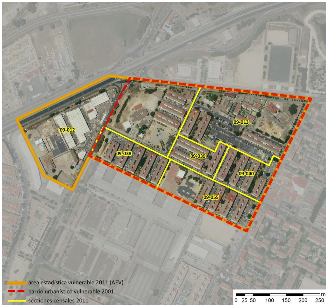
Localización en detalle del AEV