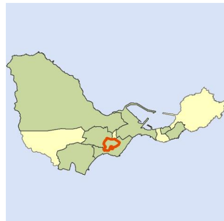
Localización del AEV dentro del término municipal