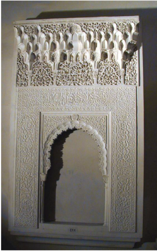
Taqa de la Sala de la Barca 140x90x15cm