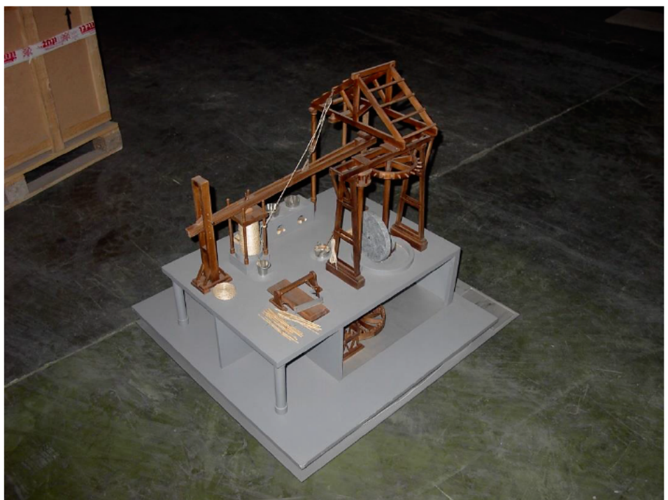
Molino caña de azúcar 93x80x80 cm