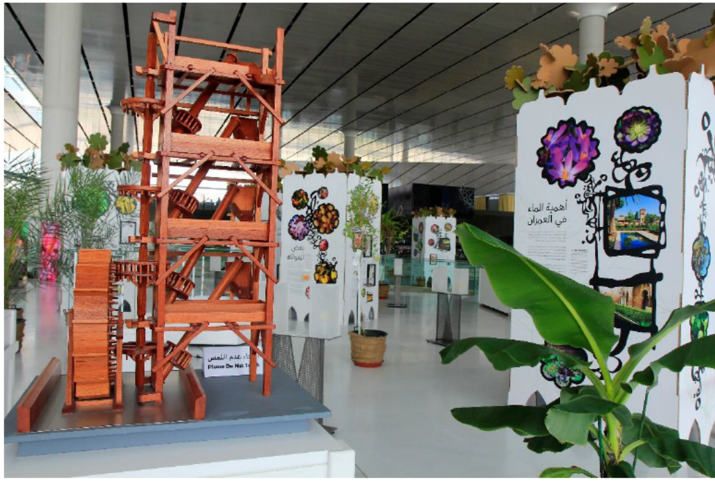
Máquina de agua II. 120 x 94 x 60 cm.