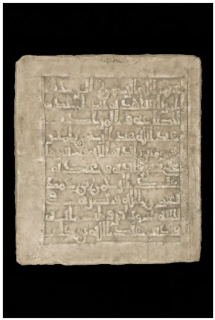
Lápida fundacional de las Atarazanas de Tortosa 5 x 48 x 53.5 cm.