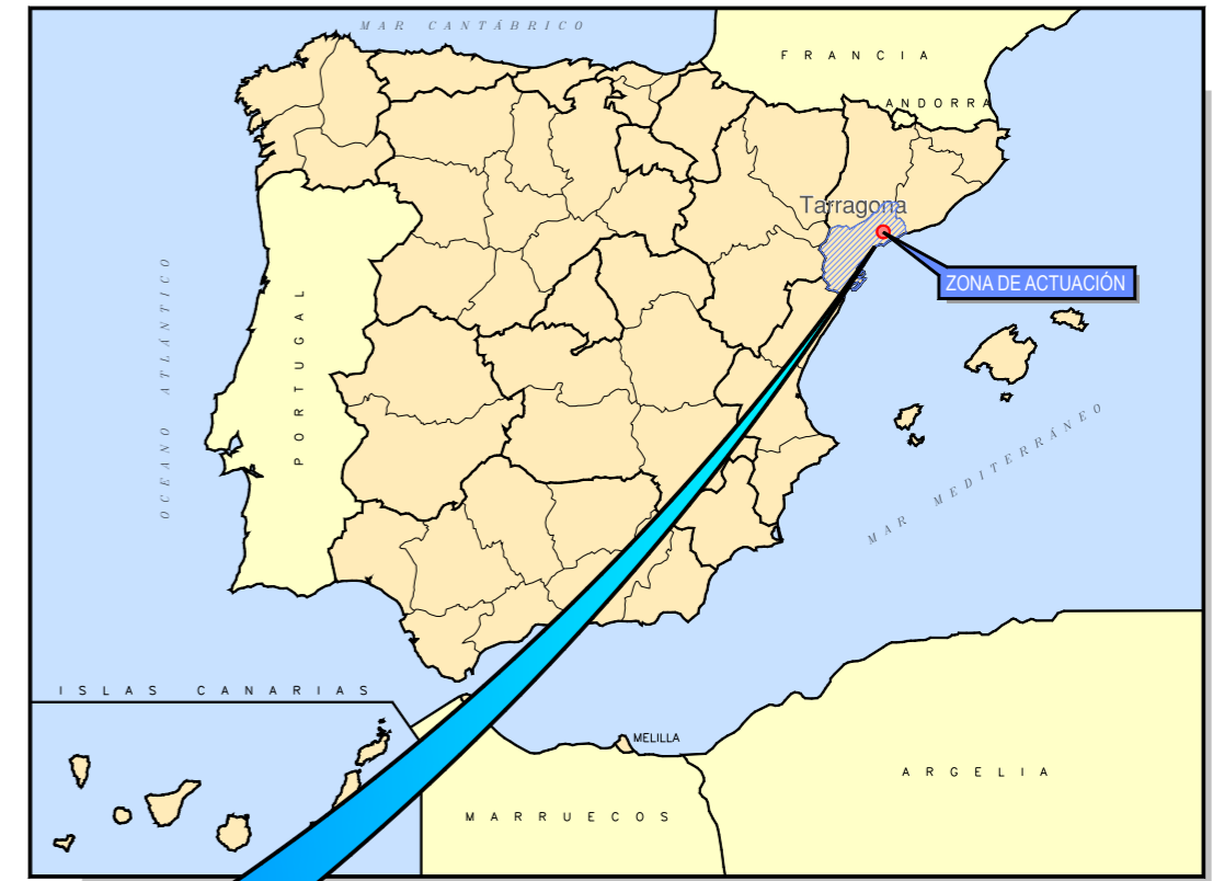
SITUACIÓN GEOGRÁFICA SIN ESCALA