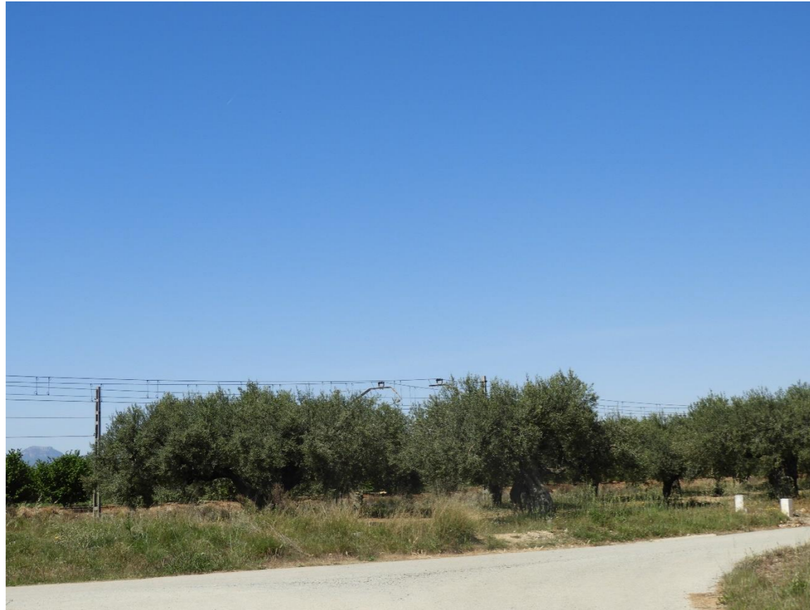
Cultivos leñosos en el ámbito de estudio.