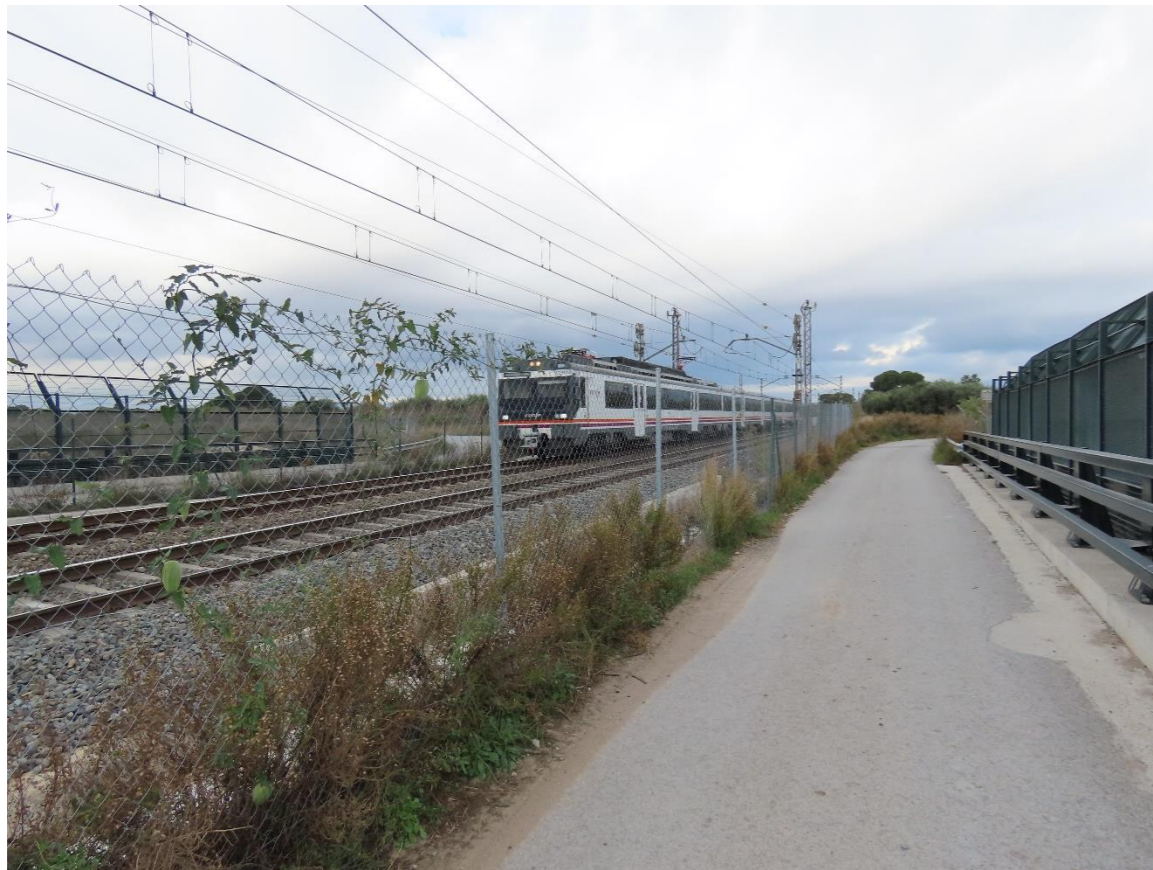
Paso superior a demoler y reponer.