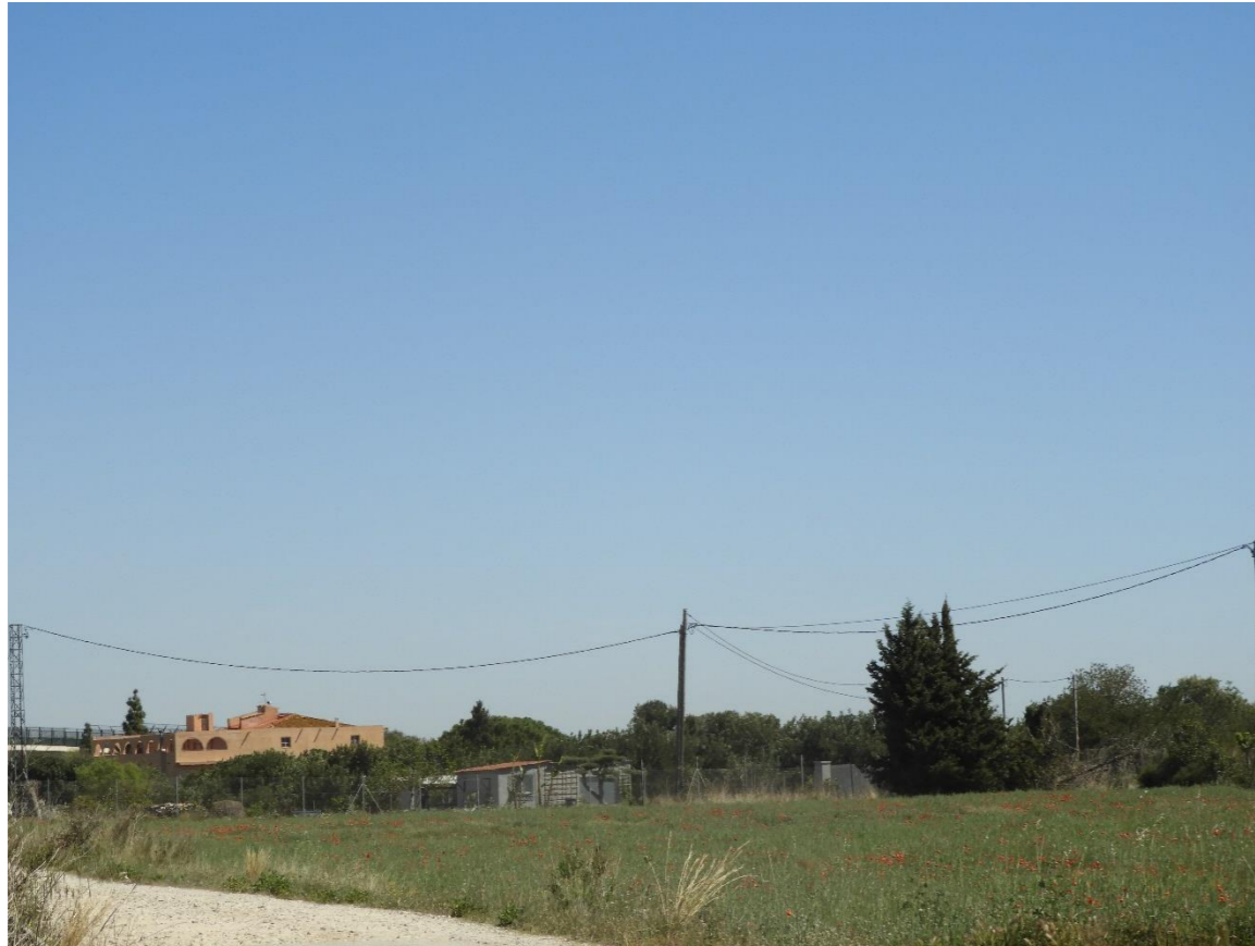
Zona de ubicación del futuro aparcamiento.