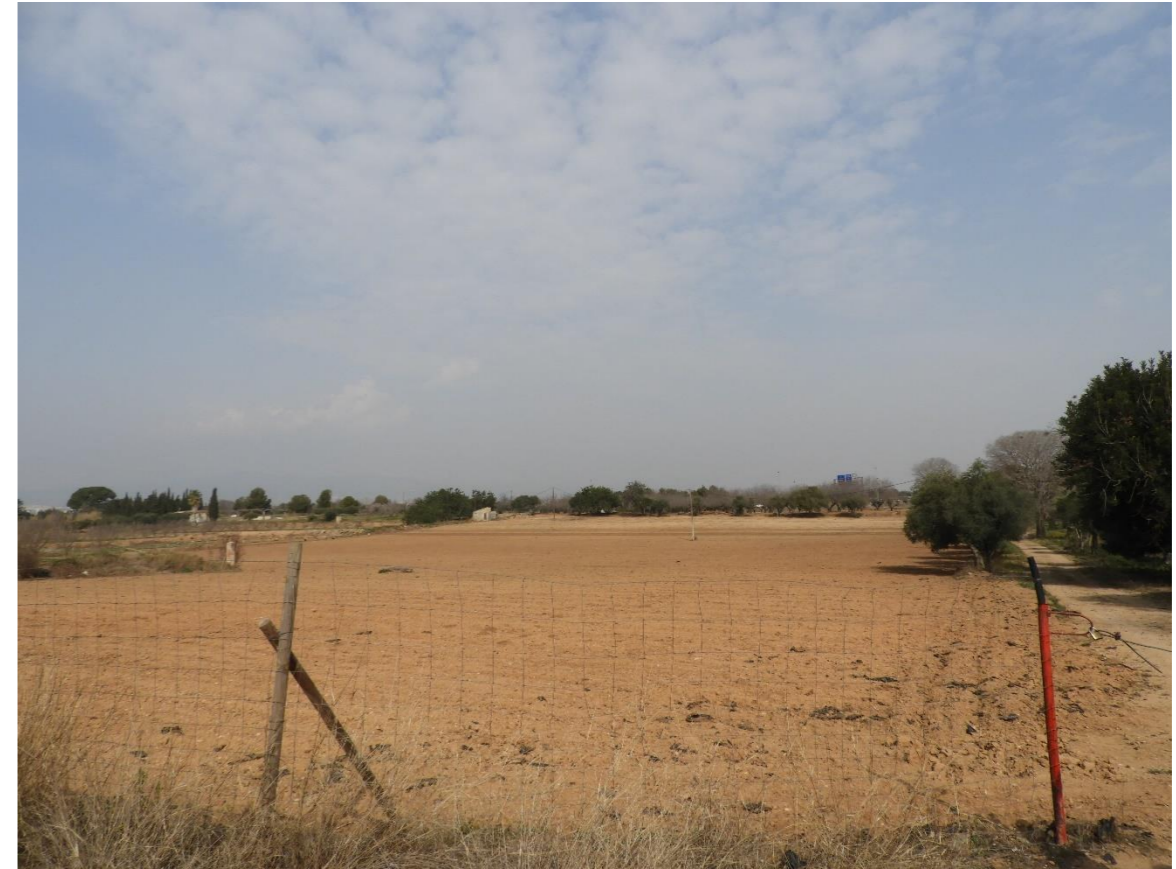
Zona de ubicación del camino de acceso.