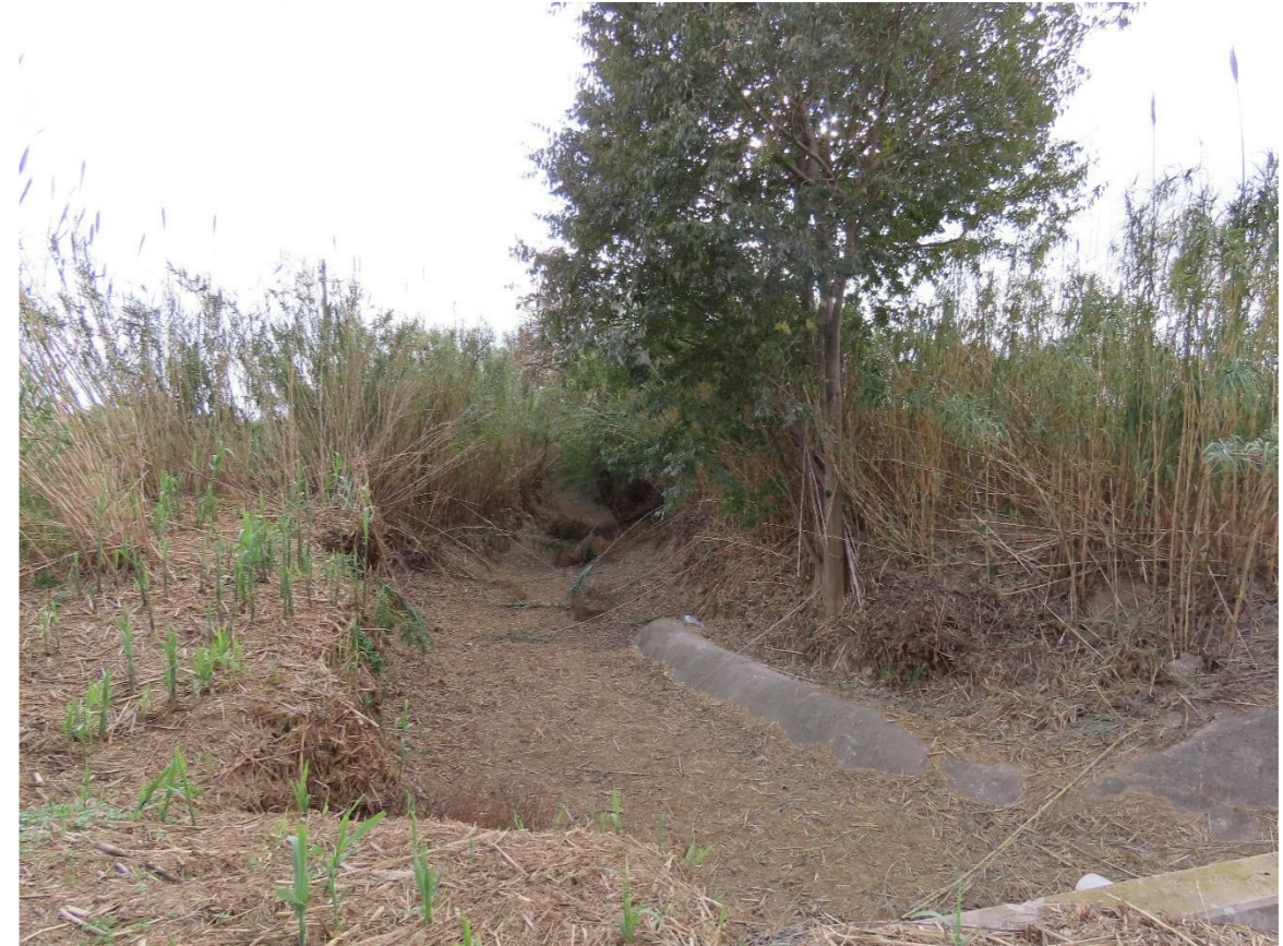
Riera de Boella i rasa del Mas de Sostres.