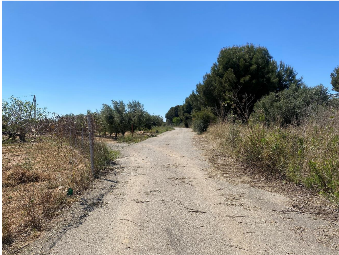
Zona de conexión del futuro camino de acceso con la rotonda que conecta la autopista T-11 con la carretera T-315.