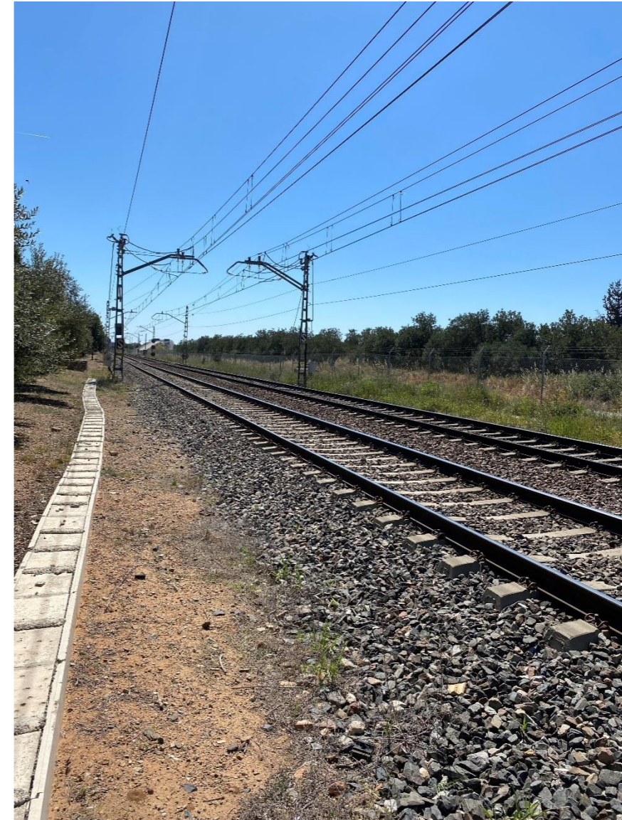
Línea de ferrocarril 210 Miraflores Tarragona a su paso por el ámbito de estudio