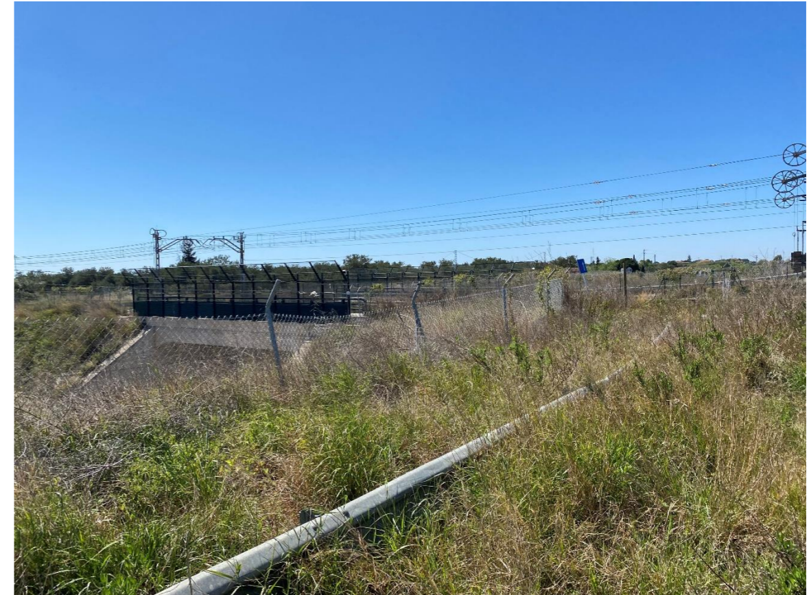
Línea ferroviaria y paso superior dónde se ubicará la futura estación intermodal.