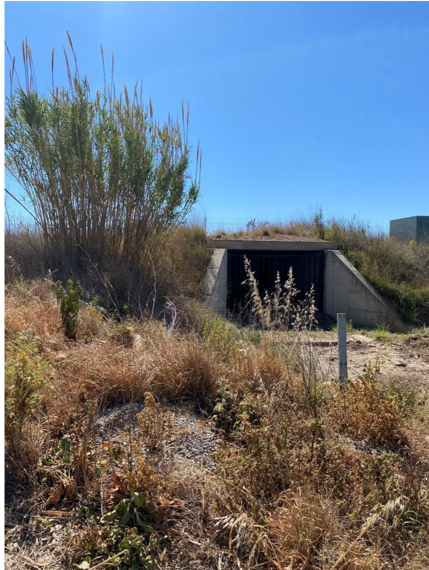
Estructura transversal a la vía con vallado en la boca del paso.