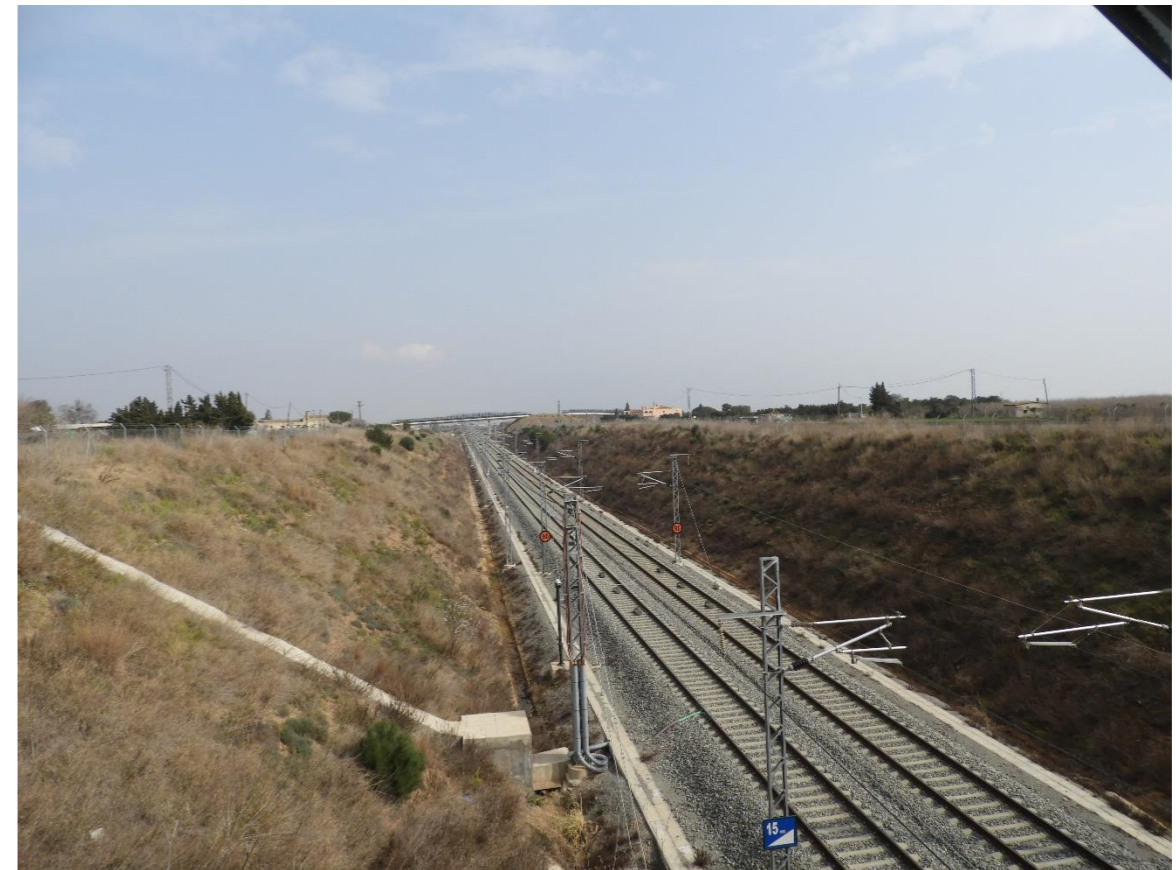
Infraestructura ferroviaria del Corredor Mediterráneo a su paso por el ámbito de estudio