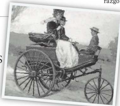
Bertha Benz

Uno de los primeros nombres que hay que mencionar es el de Bertha Ringer, una mujer sin la que probablemente una marca como Mercedes-Benz no existiría hoy en día. La esposa del famoso fabricante de automóviles es considerada la primera mujer que rea-