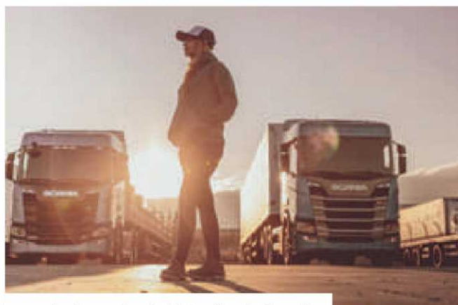
La presencia de la mujer en el transporte y la logística es más clara en la administración y la dirección.

La Asociación del Transporte Internacional por Carretera (Astic) demanda a las Administraciones públicas, tanto españolas como europeas, una mayor implicación e inversión en políticas enfocadas en favorecer la incorporación de las mujeres a la profesión de transportista.