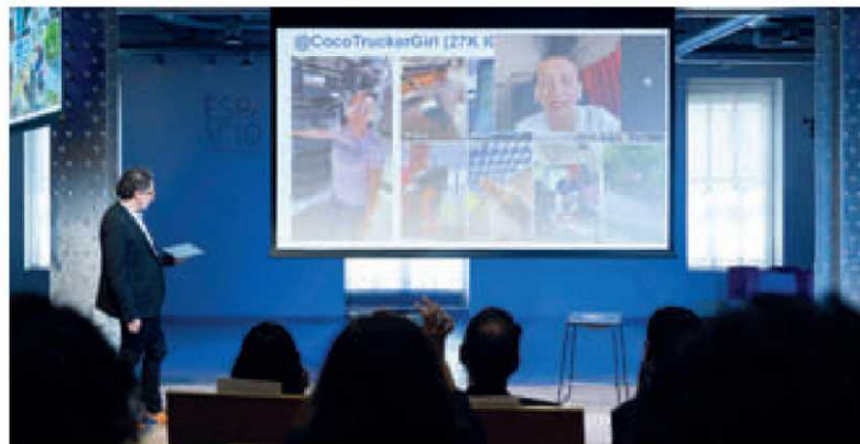
Distintos momentos de la Jornada de Astic sobre la mujer y el transporte por carretera.