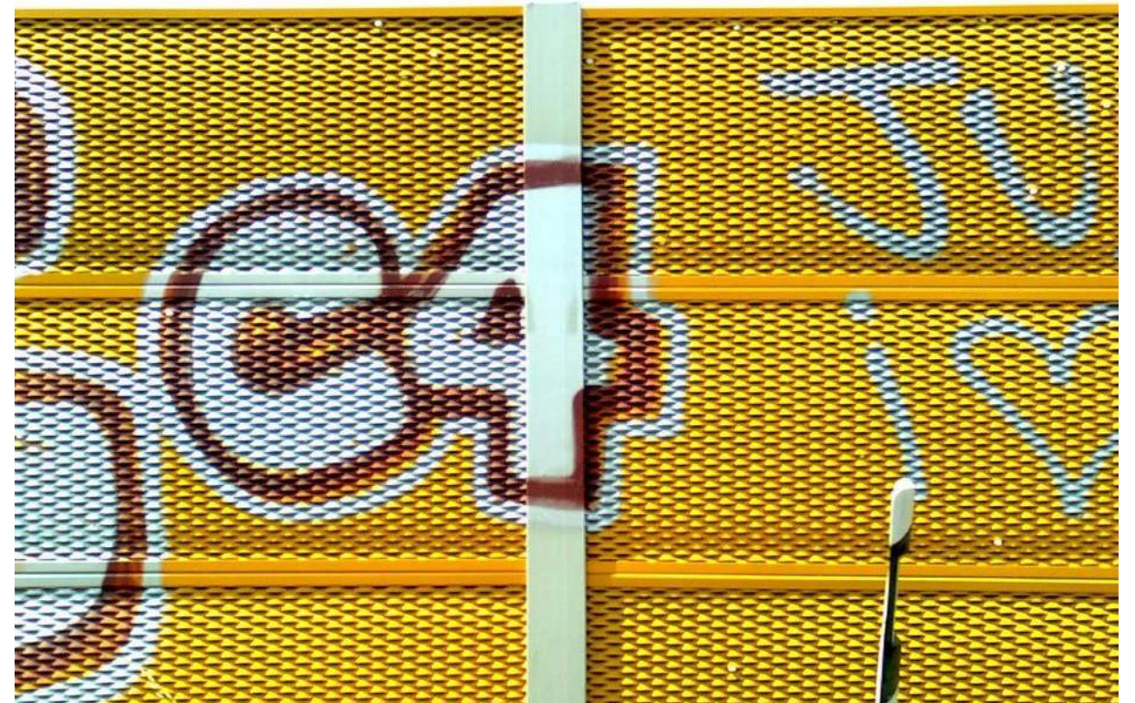
Fotografía 1. Grafiti en pantallas acústicas de metacrilato.