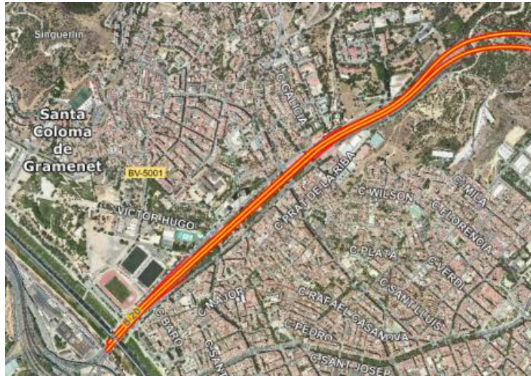
Ilustración 1. Ubicación general del ámbito del estudio.

A continuación, se detallan los distintos planes urbanísticos que tienen incidencia en el trazado de la vía o en la edificación que le da frente, todos ellos aprobados definitivamente con anterioridad a la aprobación de la Ley 37/2015, de 29 de septiembre, de carreteras, según se recoge en la propuesta de Estudio remitido por el citado Ayuntamiento: