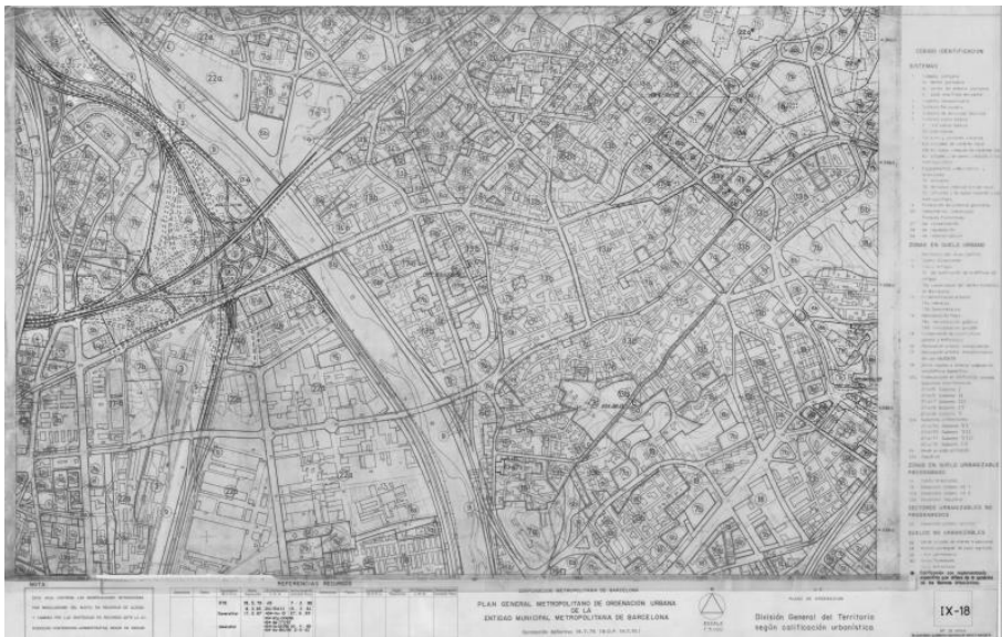
Ilustración 2. Extracto del plano IX-18 del Plan General Metropolitano, relativo a la División General de Territorio según calificación urbanística en la zona del Estudio.