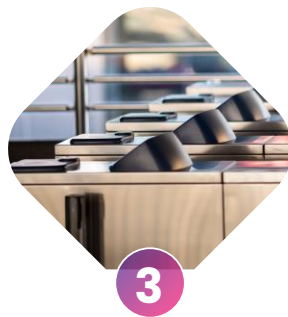
3 validación salida