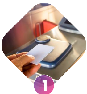
1 validación entrada

Permite viajar en Cercanías pagando con la tarjeta bancaria en el torno